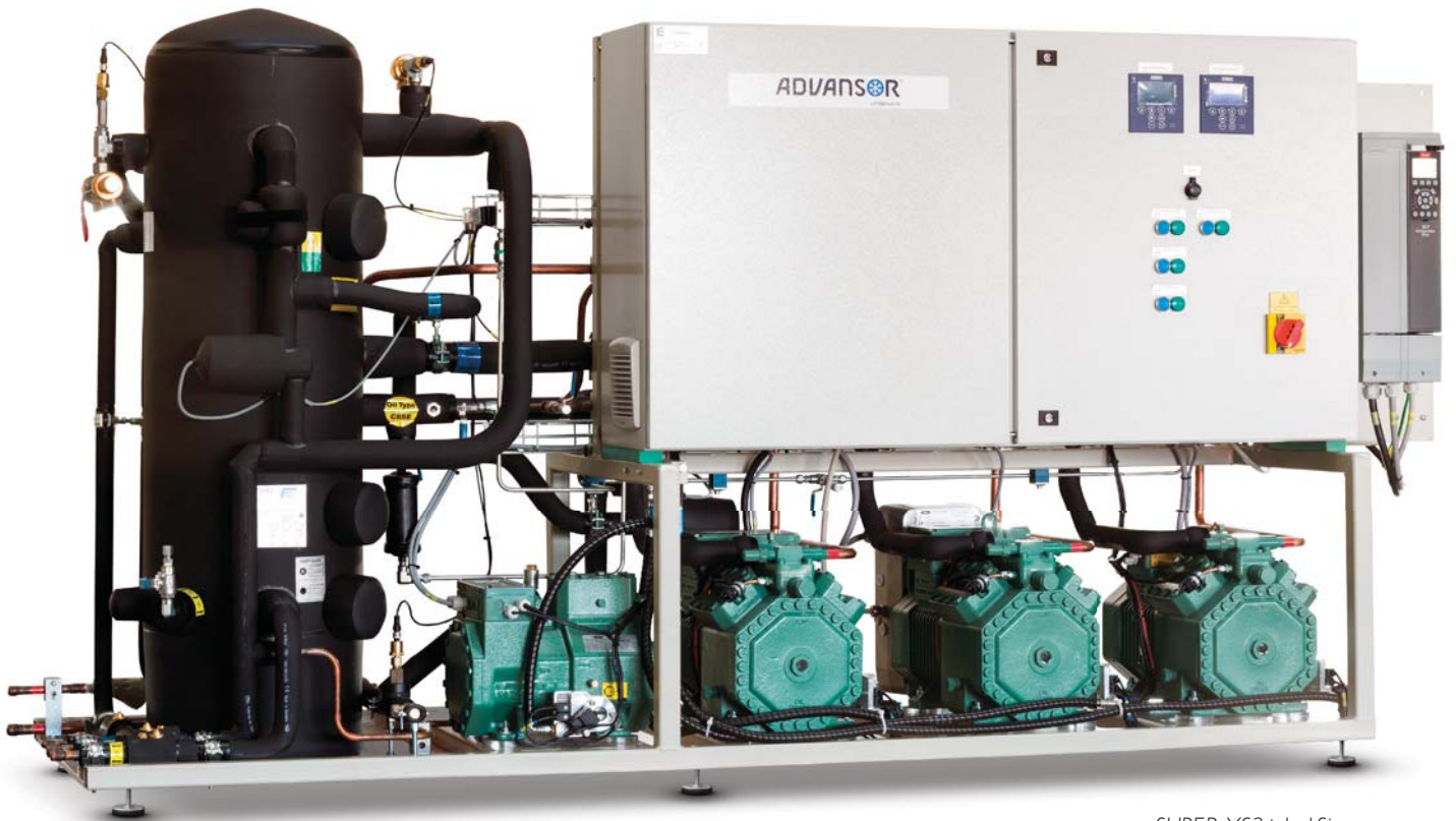
compSUPER XS2+ 1x1 Sigma