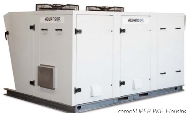
compSUPER PKE Housing (XS 3x2 VP)