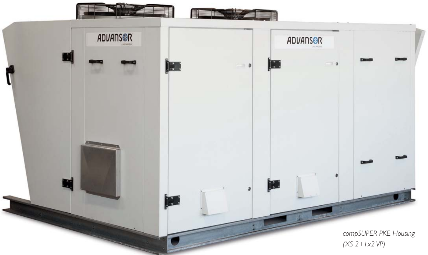
compSUPER PKE Housing (XS 2+ 1x2 VP)