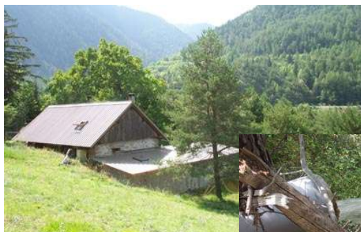
En haut : Maison en site isolé de la famille Blanche.