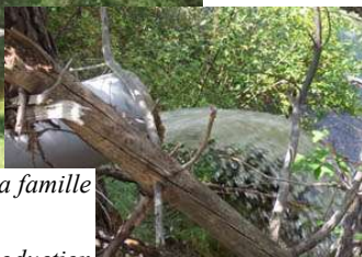
A droite : l'eau utilisée pour la production d'électricité (en sortie de centrale)

Mme et Mr Blanche 1 habitent depuis 1985 une maison isolée située en contrebas d'un flanc de montagne dans les Alpes de Haute Provence (04).