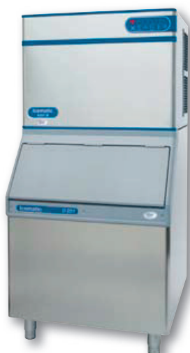
N202M sur D201

PROTECTED BY agion ANTIMICROBIAL PRODUCT PROTECTION