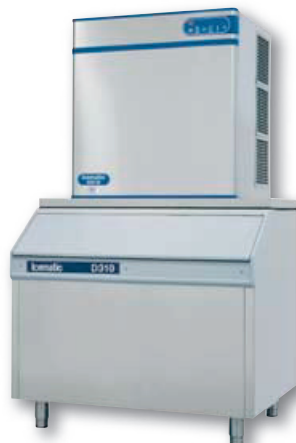
N502M sur D310