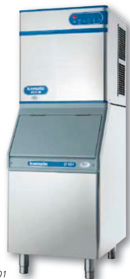
N132M sur D101