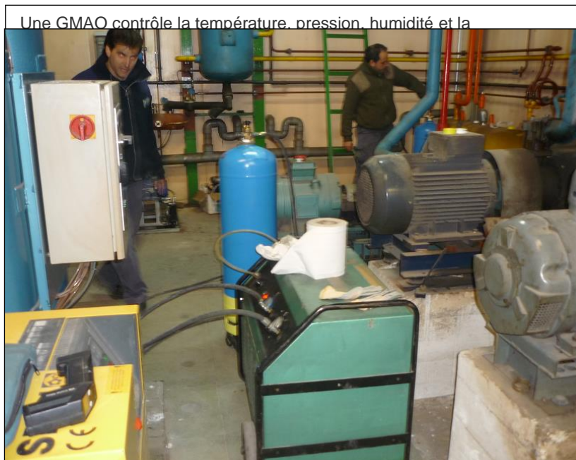
Une GMAO contrôle la température, pression, humidité et la

Après 3 heures de fonctionnement apparaît une fuite au niveau d'un joint du compresseur (type néoprène). Celui-ci est changé. En effet certains très anciens joints composés de caoutchouc doivent être remplacés par d'autres actuels appropriées aux HFC comme par exemple le Téflon, Klingerit, HNBR.